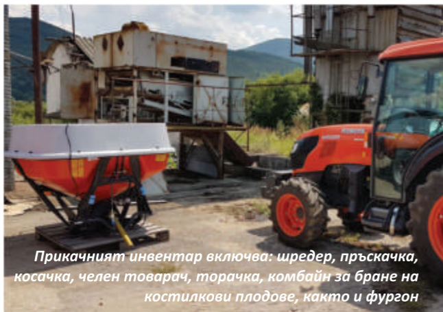
Прикачният инвентар включва: шредер, пръскачка, косачка, челен товарач, торачка, комбайн за бране на костилкови плодове, както и фургон