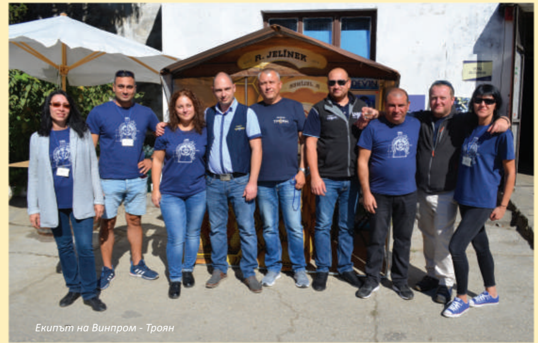
Екипът на Винпром - Троян

Всеки посетител получи малка бутилка 7-годишна стара Троянска сливова ракия със специално изработен етикет за спомен от събитието. Традицията беше спазена, а празникът е незабравим. Срещата с нашите клиенти, както и положителната обратна връзка с тях ни убеждават, че сме си свършили работата добре и нашите продукти получават висока оценка от почитателите на Троянска сливова ракия. Благодарим на всички, които ни посетиха и се надяваме да се видим отново и догодина!