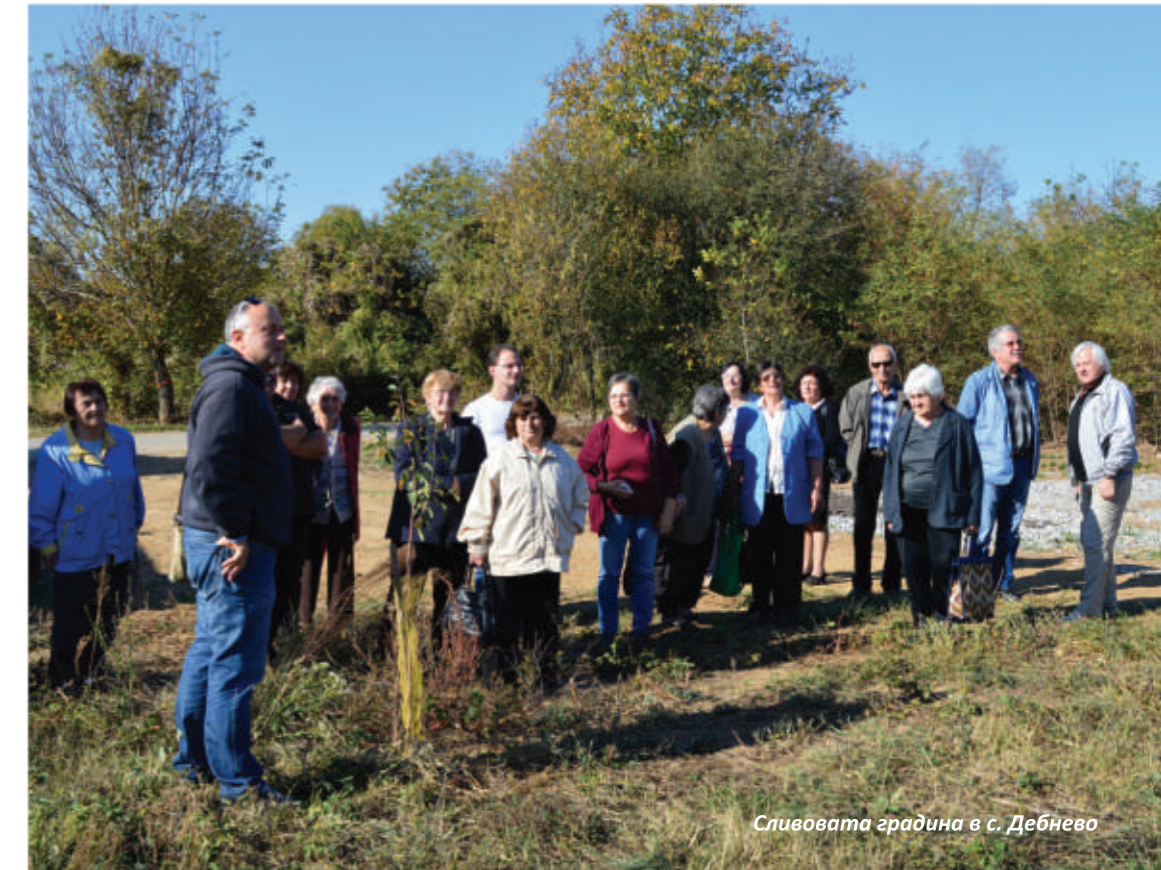
Сливовата градина в с. Дебнево

но и трябва да са здрави, за да се гради бъдеще върху тях.