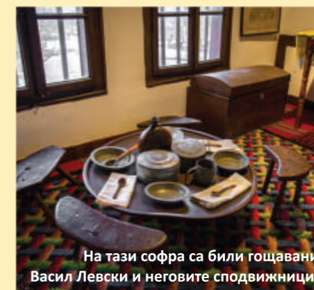
На тази софра са били гощавани Васил Левски и неговите сподвижници.

Стаята със софрата се намира в северния край на третия етаж на манастира, от прозорците на която се открива гледка към Орешак и е възможно да се забележи идването на турци. В тази манастирска килия е имало таен изход през дрешника към покрива, откъдето Левски е можел да избяга в гората.