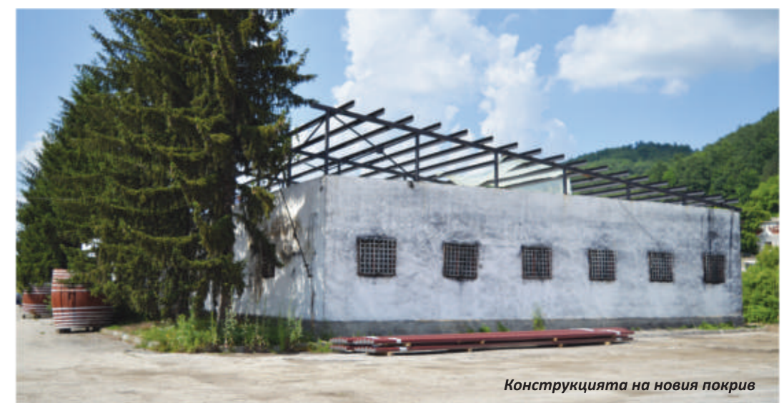
Конструкцията на новия покрив

В близко бъдеще ни предстои реконструкция на външната фасада на сградата и освежаване на вътрешната ѝ част.