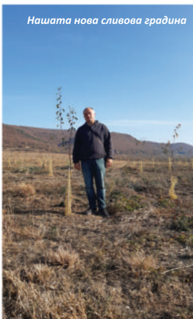
Нашата нова сливова градина

ри сорта сливи: Стенлей, Йойо, Чачанска лепотица и Топ енд. Проектът цели да възстанови традицията за отглеждане на качествени сливи и производството на качествена сливова ракия в Троянски регион.