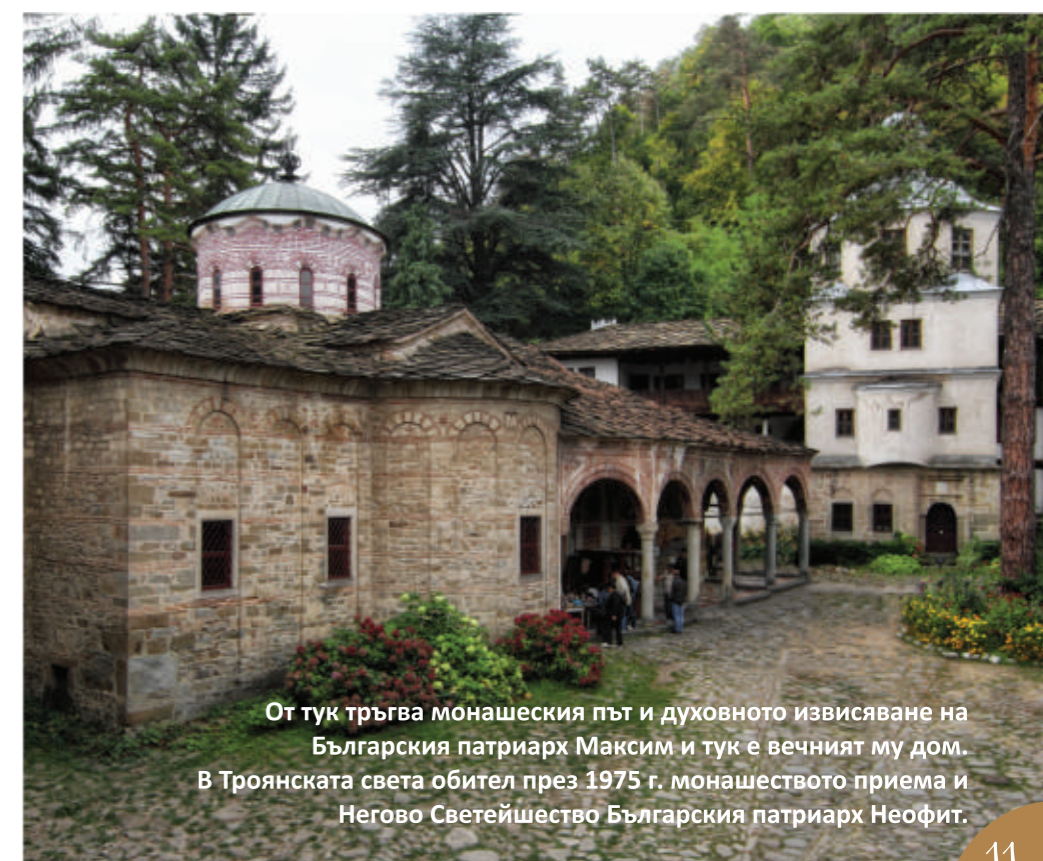
От тук тръгва монашеският път и духовното извисяване на Българския патриарх Максим и тук е вечният му дом. В Троянската света обител през 1975 г. монашеството приема и Негово Светейшество Българския патриарх Неофит.