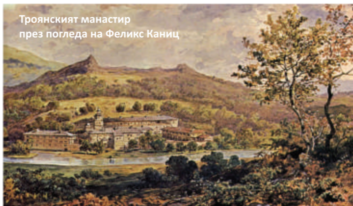
Троянският манастир през погледа на Феликс Каниц

тук функционираше килийно училище. Много будни духовници от Възраждането са получили образованието си тук. По икониписите в манастира през 1847/48 г. работи Захари Зограф. За първи път тук той изработва композицията със светите братя просветители Кирил и Методий, придържащи свитък с азбуката, която в цяла България се използва и днес. В църквата може да се види и неговият автопортрет.