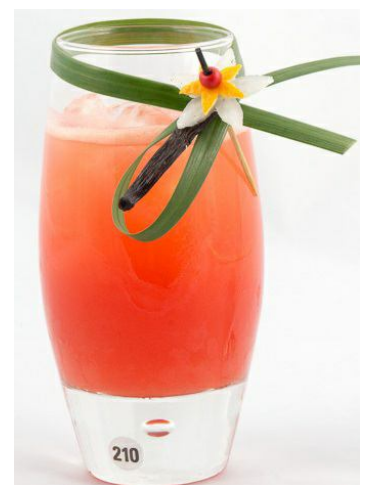
Grand Horizon донесе първа награда на Доса Иванов от Швеция.