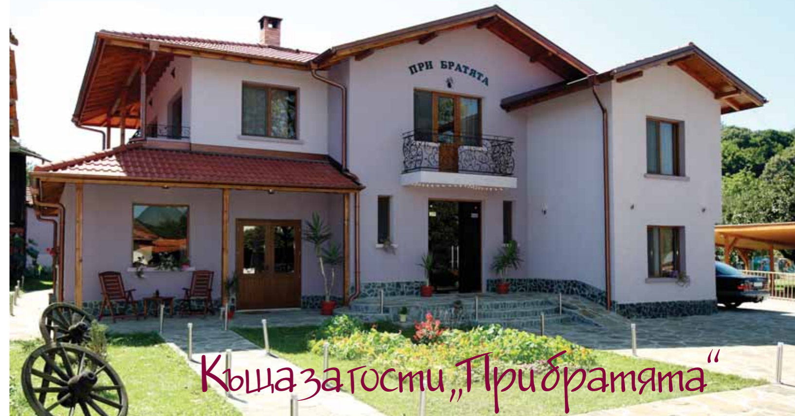
Къща за гости „При братята“

Къща за гости „При братята“ с. Орешак Троянско е къща с настроение и дух. Сгушена в Троянския балкан, тя е топла през зимата и прохладна през лятото.