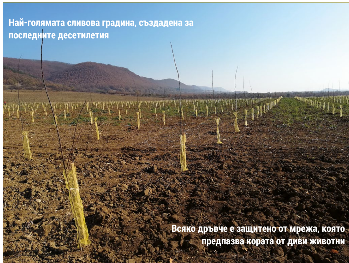
Най-голямата сливова градина, създадена за последните десетилетия