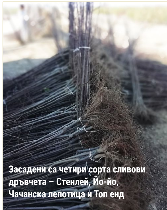
Засадени са четири сорта сливови дръвчета – Стенлей, Йо-йо, Чачанска лепотица и Топ енд