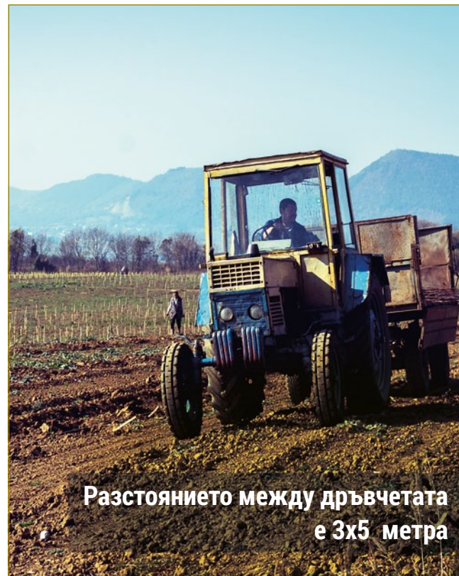
Разстоянието между дръвчетата е 3x5 метра