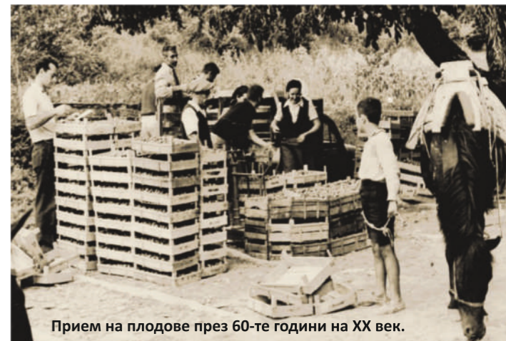
Прием на плодове през 60-те години на XX век.

През 1990 г. с демонополизирането на отрасъла е регистрирана държавна фирма "ВИНПРОМ - ТРОЯН". Следват редица преобразувания и през 1997 г. чрез масова приватизация е регистрирано акционерно дружество "ВИНПРОМ - ТРОЯН". През 2007 г. мажоритарния дял във фирмата придобива най-големият европейски производител на плодови дестилати, чешката фирма "РУДОЛФ ЙЕЛИНЕК" АД. Дружеството поддържа дълготрайни търговски взаимоотношения с чуждестранни партньори в Чехия, Германия, Швейцария, Австрия, Словакия, Хърватия и САЩ, за които ежегодно изнася своята продукция. Плодовите дестилати на "ВИНПРОМ – ТРОЯН" АД притежават сертификат по KOSHER производство и са съобразени с еврейските традиции за храненето.