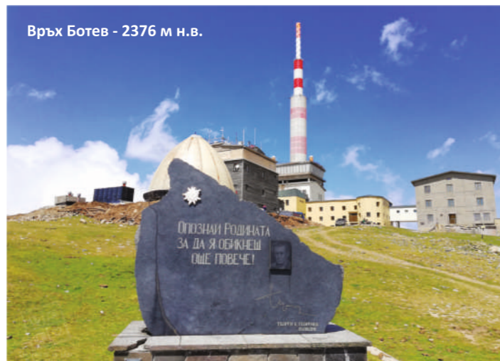
Връх Ботев - 2376 м н.в.

Хижа „Плевен“ е една от най-добре поддържаните и популярни сред туристите хижи в Централна Стара планина. Този район предлага разнообразни възможности за походи. Високо в облаците, близо до звездите, сред магична природа. Там където човек може да остане сам със себе си и да се потопи във вълшебството на планината, се намира своеобразната Читалня „Книги в облаците“. Създадена е с цел да се създаде едно уютно високопланинско място с невероятен изглед към величествения връх Ботев и необятната красота на Северен Джендем, в което на спокойствие и тишина човек може да се отдаде на книгите.