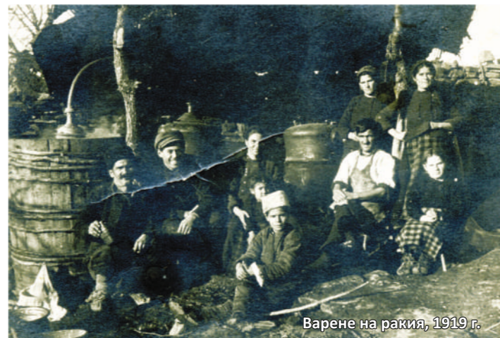
Варене на ракия, 1919 г.