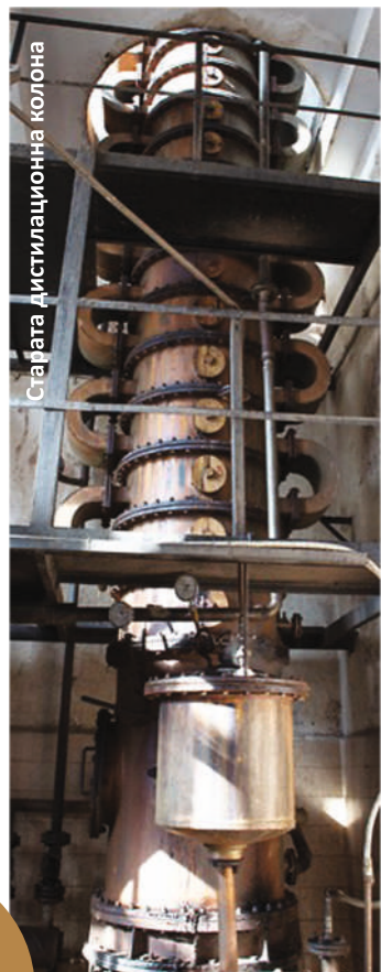
Старата дестилационна колона