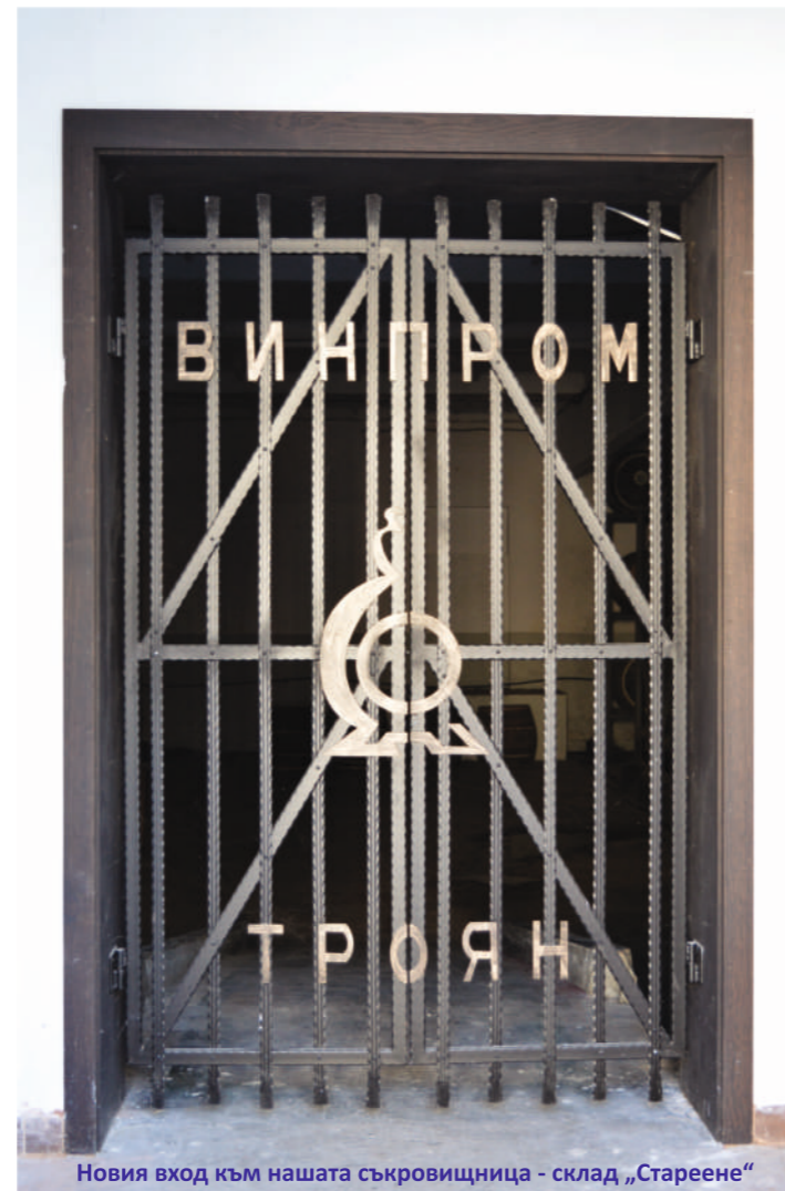
Новия вход към нашата съкровищница - склад „Стареене“

известителната система и всички водопроводи. Всички стени и тавани бяха почистени и преобоядисани. Двете помещения на входа също бяха преустроени, едното беше обособено като санитарен възел, който ще служи предимно за посетители на завода, а другото помещение беше преустроено в малко сервизно пространство за подготовка на дегустации за провежданите екскурзии за туристи в завода. Сменени бяха всички врати и прозорци, така че входното помещение приамва посетителите с визия