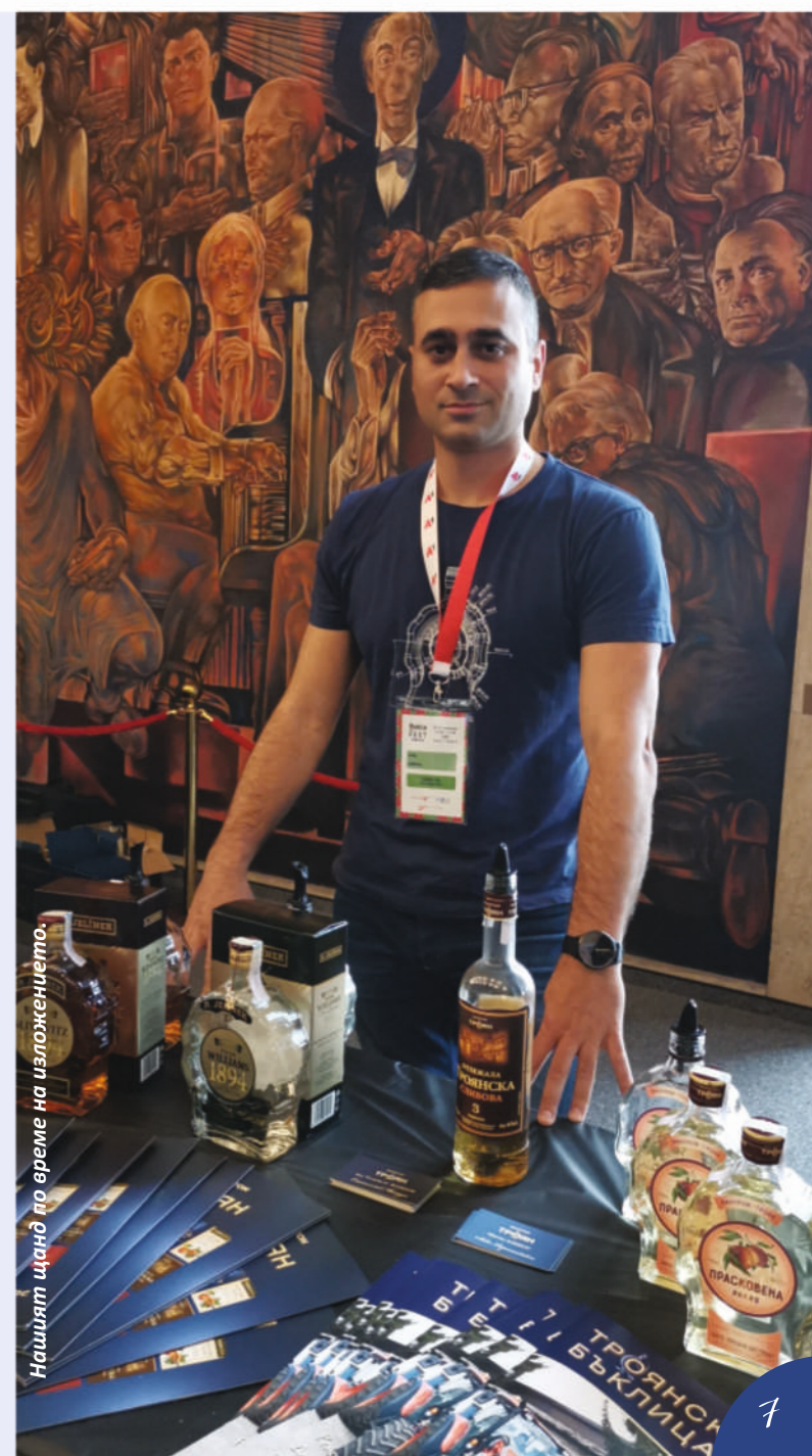
Нашият щанд по време на изложението.

Трузнание от „Rakia & Spirits Fest 2019“