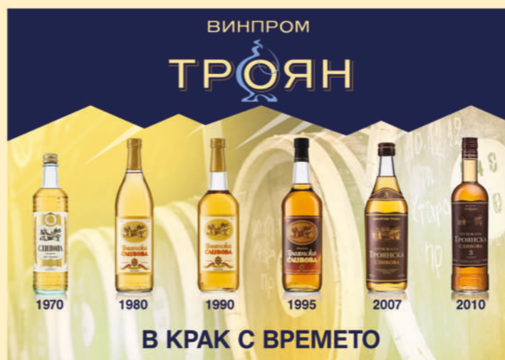
В КРАК С ВРЕМЕТО

използваме в настоящите етикети само за сливовите ракии, като гаранция за произход и качество. При останалите видове плодови ракии сме избрали изображения на плодовете, от които съответните ракии са направени. Продуктът може да бъде закупен от електронния магазин на „ВИНПРОМ – ТРОЯН“ АД или във фирмения ни магазин, намиращ се в гр. Троян.