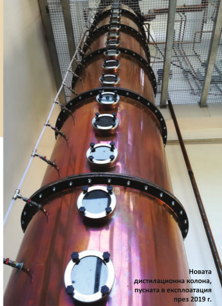
Новата дистиляционна колона, пусната в експлоатация през 2019 г.