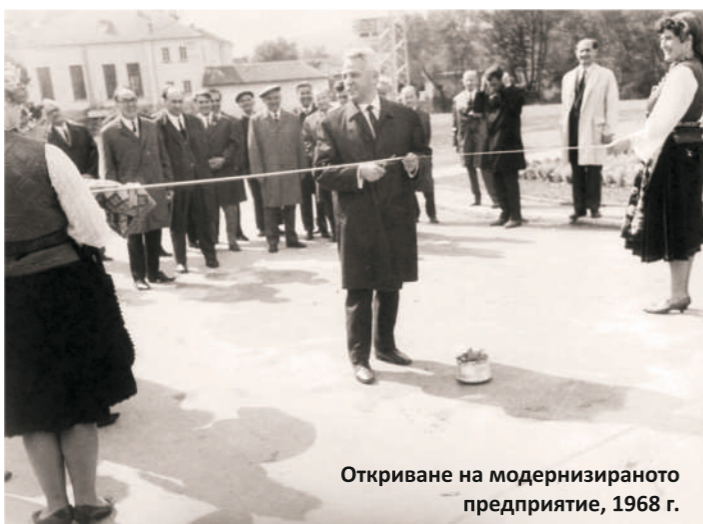
Откриване на модернизираното предприятие, 1968 г.